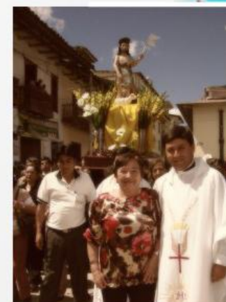
San Juan Bautista