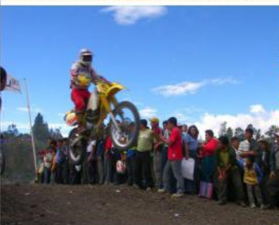
Concurso "FLOR DEL CHOT"