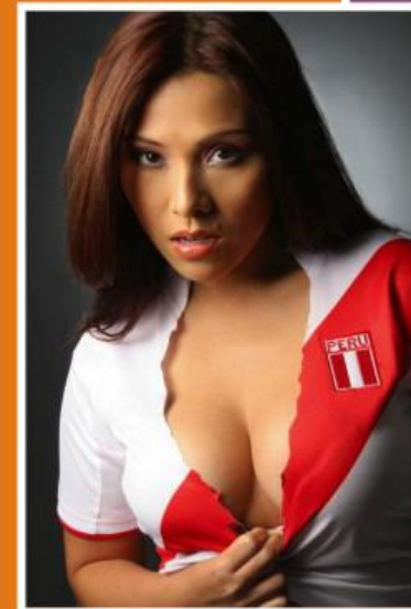
Tula Rodríguez Animadora