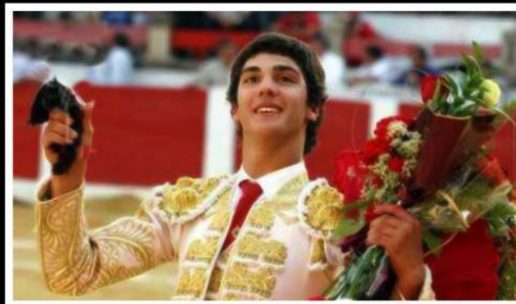
Jairo Miguel Matador de toros más joven de España. Con actuación en la Feria de San Isidro de las Ventas de Madrid.